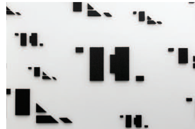
Tania Mouraud, ICI/LÀ, (détail), 1994-1995 Vue de l'exposition «Tania Mouraud. Une rétrospective», Centre Pompidou-Metz, 2015

Tania Mouraud réalise de nombreuses peintures-relief en prenant l'écriture comme motif. Elle joue sur l'esthétique des mots et des codes de lecture pour faire passer des messages. Et toi, reconnais-tu ces mots *?