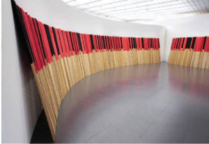
Tania Mouraud, Le Silence des héros, 1995-1996 Vue de l'exposition « Tania Mouraud. Une rétrospective », Centre Pompidou-Metz, 2015