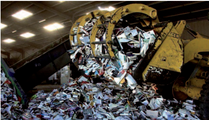
Tania Mouraud, AD NAUSEAM, 2014 Installation vidéo Son Tania Mouraud assistée de l'Ircam Production Tania Mouraud, Ircam - Centre Pompidou © ADAGP, Paris 2014 © Vidéogramme Tania Mouraud