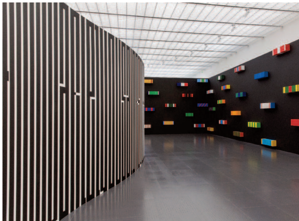
Tania Mouraud, MDQRPV?, 2015 et DE LA DÉCORATION À LA DÉCORATION (France), 1994-1995 Vue de l'exposition «Tania Mouraud. Une rétrospective», Centre Pompidou-Metz, 2015

Observe cette écriture étirée. Reconnais-tu des lettres ? Tania te livre un message comme une confidence, qu'il te faudra déchiffrer avec patience.